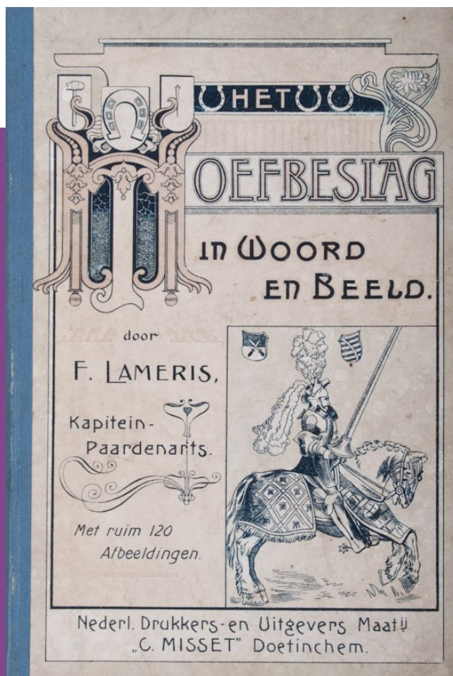
Afb. 8. Omslag van het door Friedes Jan(s) Laméris geschreven boek: Het hoefbeslag in woord en beeld (Doetinchem 1904).